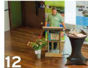
Meer oog voor bestuivers door ondertekenen Bijenstrategie.

Nieuwe koers voor fietsers Het waterschap gaat voor een nieuwe koers in de fietspaden. Niet meer streven naar meer kilometers aan nieuw fietspad maar naar verbreding van bestaande paden.