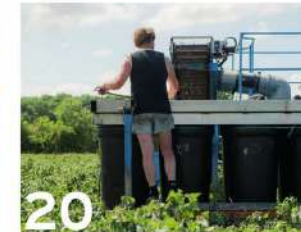
Als je op de wagen staat bij de zwarte bessenteelt ben je crouper.